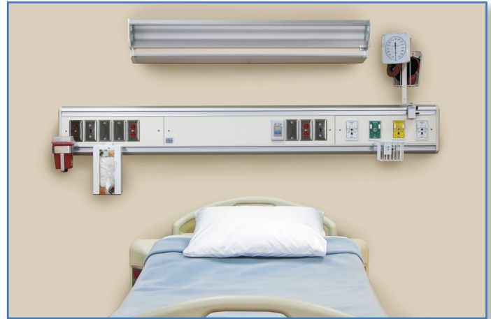
Figure 1. Le module mural encastré de la série << Majestic >> avec services sur un niveau

Le module mural encastré de la série << Majestic >> avec services sur un niveau est manufacturé par Amico selon les dessins d'atelier approuvés et selon tous les autres documents pertinents à ce projet. L'unité complète reçoit l'homologation cULus. Le texte qui suit, se veut une spécification générale et tous les éléments qui y sont décrits ne reflètent pas nécessairement les besoins du produit tel que requis dans un projet spécifique.