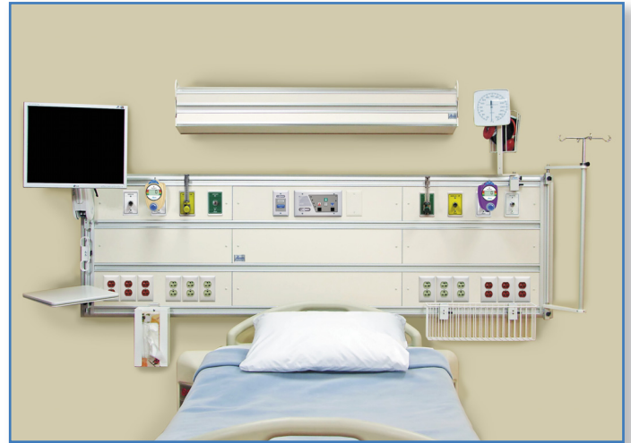
Figure 1. Le module mural encastré de la série Majestic avec services sur deux niveaux

Le module mural encastré de la série Majestic avec services sur deux niveaux est manufacturé par Amico selon les dessins d'atelier approuvés et selon tous les autres documents pertinents à ce projet. L'unité complète reçoit l'homologation cULus. Le texte qui suit, se veut une spécification générale et tous les éléments qui y sont décrits ne reflètent pas nécessairement les besoins du produit tel que requis dans un projet spécifique.