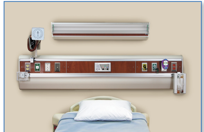
Figure 1. Le module mural de surface de la série << Majestic >> avec services sur un niveau

Le module mural de surface de la série << Majestic >> avec services sur un niveau est manufacturé par Amico selon les dessins d'atelier approuvés et selon tous les autres documents pertinents à ce projet. L'unité complète reçoit l'homologation cULus. Le texte qui suit, se veut une spécification générale et tous les éléments qui y sont décrits ne reflètent pas nécessairement les besoins du produit tel que requis dans un projet spécifique.