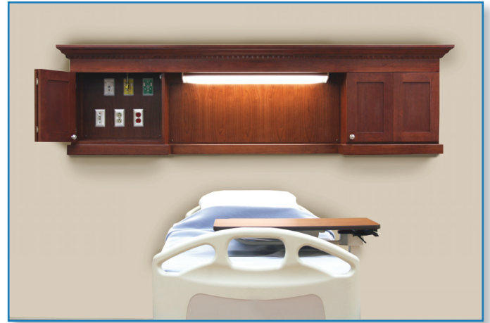
Figure 1. La série murale << Reflet LDR >> << LDR Poupons >>

La série murale Reflet <<LDR>> est manufacturée par Amico selon les dessins d'atelier approuvés et selon tous les autres documents pertinents à ce projet. Le texte qui suit, se veut une spécification générale et tous les éléments qui y sont décrits ne reflètent pas nécessairement les besoins du produit tel que requis dans un projet spécifique.