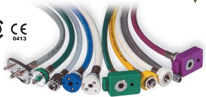
Les ensembles de boyaux