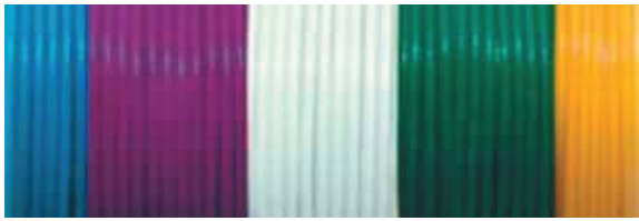
Boyaux en vrac